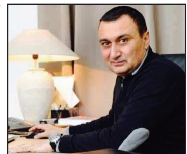
მოამზადა კახა ხატიაშვილი

გავრილოვის სახელის უკვდავყოფა ჩვენი, ქართველების, ზემოცნა არ უნდა იყოს. დაფიქრდით ამაზე! თუ მინცდამინც კალენდარული მითითება გჭირდებათ, შეგიძლიათ, თარიღი დაასახელოთ – 20 ივნისის და არა „გავრილოვის ღამე“. ნუ უკვდავყოფთ ვიღაც გავრილოვის გვარს საქართველოში. ეს არაფერს მოგცემს.