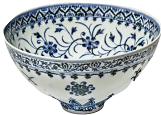
მოამზადა კახა ხატიაშვილი

ამერიკის კონკრეტული შტატში აღმოჩნდა მინის დინასტიის დროინდელი უიშვიანის ფაიფურის თასი, რომელიც ნახევარ მილიონ დოლარად შეფასდა.