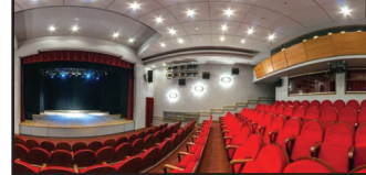
მოამზადა კახა ხატიაშვილი

ალექსანდრე გრიბოედოვის სახელობის სახელმწიფო თეატრი ახალ სეზონს ორი სპექტაკლის პრემიერით გახსნის.