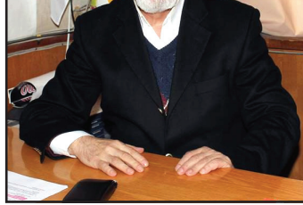
მოამზადა კახა ხატიაშვილი

„ჩაი სოლის ღაქალაბის“ გადასაღები მოედნიდან გავრცელებული ფოტოებით ირკვევა, რომ მაყურებელი, ბევრ ახალ და საინტერესო პერსონაჟთან ერთად, ძველ და საყვარელ პერსონაჟებსაც შეხვდება.