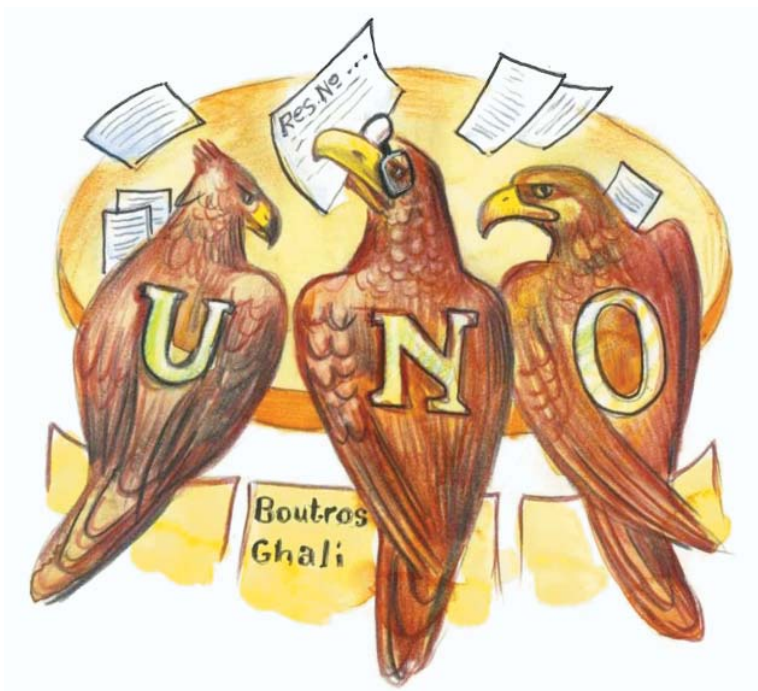
რეზოლუციებს ჩვენ არ მოგაკლებთ!