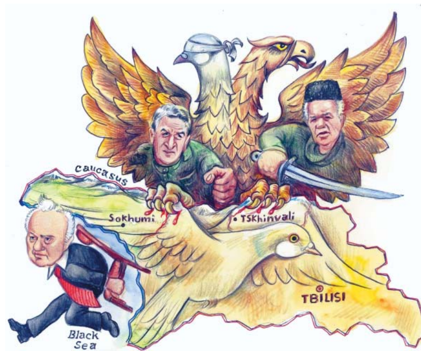
იდეის ავტორი: აკაკი მუმლაძე მხატვარი: გაბრიელ ველიჯანაშვილი