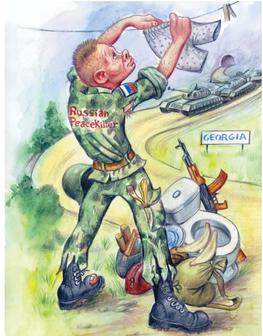
Author of the concept: Akaki Mumladze Artist: Gabriel Velijanashvili

This is the image of the Russian peace-killer with second hand spoons and forks, and WC pans, and half-dry undies just from the clothes-lines in August 2008 war.