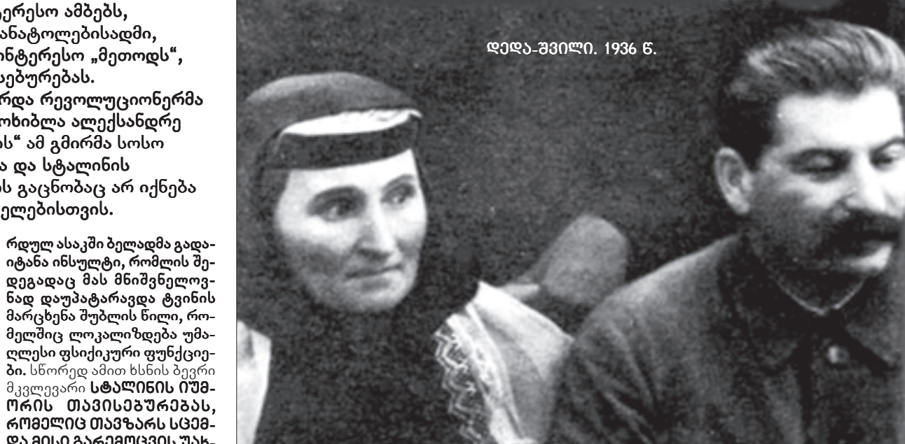
დედა-შვილი. 1936 წ.

ნახევრადწინიერი მშობლები, გლეხები (ყმების ჩამოშვები) ღარიბები იყვნენ და ცხოვრობდნენ პატარა, ნაქირავებ სახლში, გორის განაპირა უბანში, ე. წ. რუსულ კვარტალში, ძველი რუსული საარმიო ბარაკების გვერდით. Такер Р. с. 75.