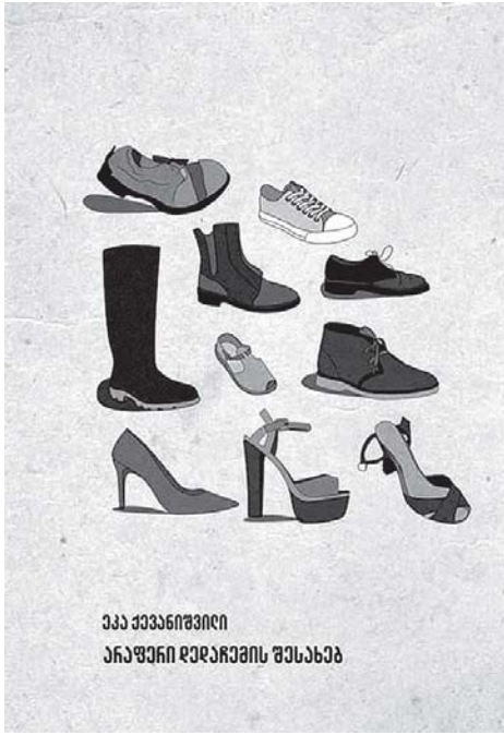
აპა ჯავახიშვილი არაფერი ღირსაჲსი მისაჲსა