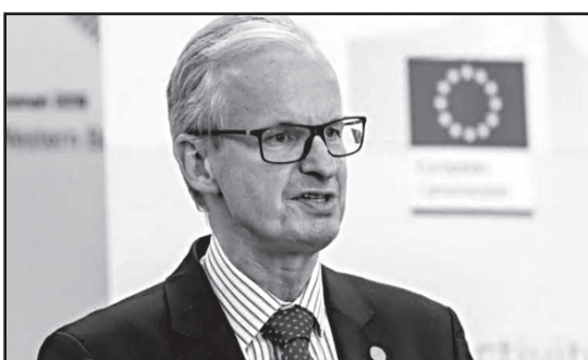
კრისტიან დანიელსონი, ევროკავშირის პოლიტიკური დიალოგის მენეჯერი.

ევროპული საბჭოს პრეზიდენტმა შარლ მიშელმა ევროკავშირის უმაღლეს წარმომადგენელთან, ჟოზეფ ბორელთან შეთანხმებით, კრისტიან დანიელსონი საქართველოში ევროკავშირის მიერ მხარდაჭერილი პოლიტიკური დიალოგის მენეჯერად დანიშნა.