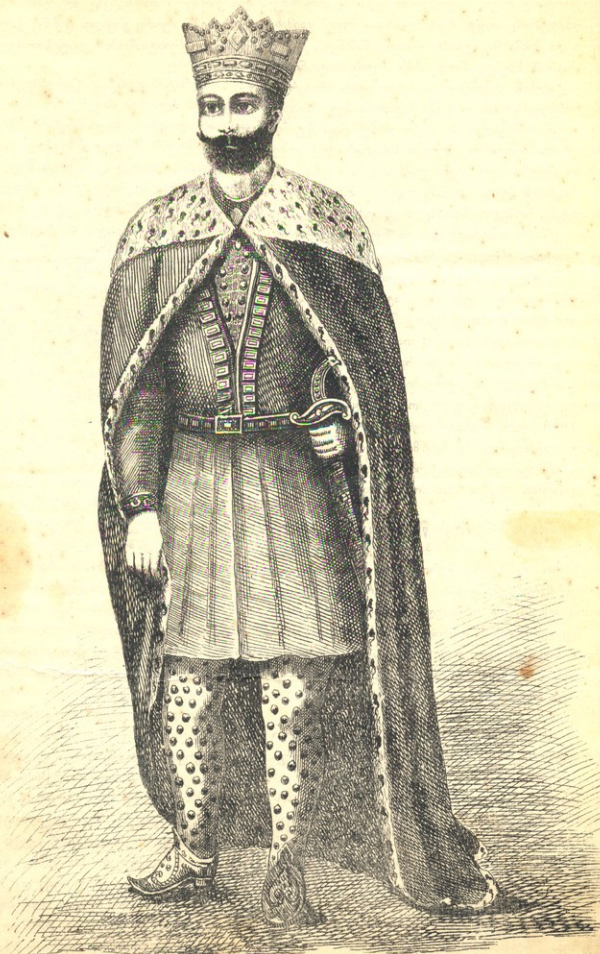
ბაგრატ V დიდი