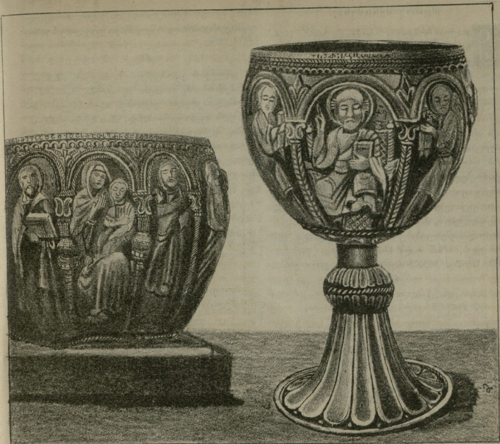
ბელის ტაძრის წმინდა ბარძიმების

საქარის სანამყენოში გააშენონ ორ გვერი ეწინააღმდეგეთ ერთი ამერიკულის ეაზისა და მეორე ამერიკულ ეაზზე დამყნლი ჩეენებური ეაზები. არამცა და არამც ნება არ მიეცეს კერძო პირს, რომ თვითონ დაიბაროს უცხოეთიდან ამერიკის ეაზის ნერგები, რადგან ამ ამერიკის ეაზსაც სჭირებია თვისებური ავადმყოფობა სახელად ბლაკროტი, რომელიც მილდუმზედ კიდევ უარესი ყოფილა.