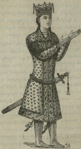
მეფე გიორგი ლაშა,

თათრებმა ორად გაჰყვეს თავის ჯარი. ერთი დამალეს და მეორე კი გამოვიდა საბრძოლად. ქართველებს ერთბაშით უნდოდათ ამ ერთი მუჟა ცხენოსანი ჯარის შემუსრა; მაგრამ თათრებმა მალე ზურგი უჩვენეს და ფეხ-მალმა ტყვეს ცხენებმა ძალიან შორს გაუსწრეს წინ ქართველების ცხენებსა. ქართველნი უკან გამოუდგნენ მათ ღამ დროს ჩასაფრებული ცხენოსანი ჯარი თათრისა ზურგით მოექცა ქართველებს და დაუწყეს ისრით ჭლტვა. ქართველები ამას არ მოელოდნენ და აირივნენ. ამ დროს წინ გაქცეულმა თათრის ჯარმაღ იხვე გამოაბრუნა