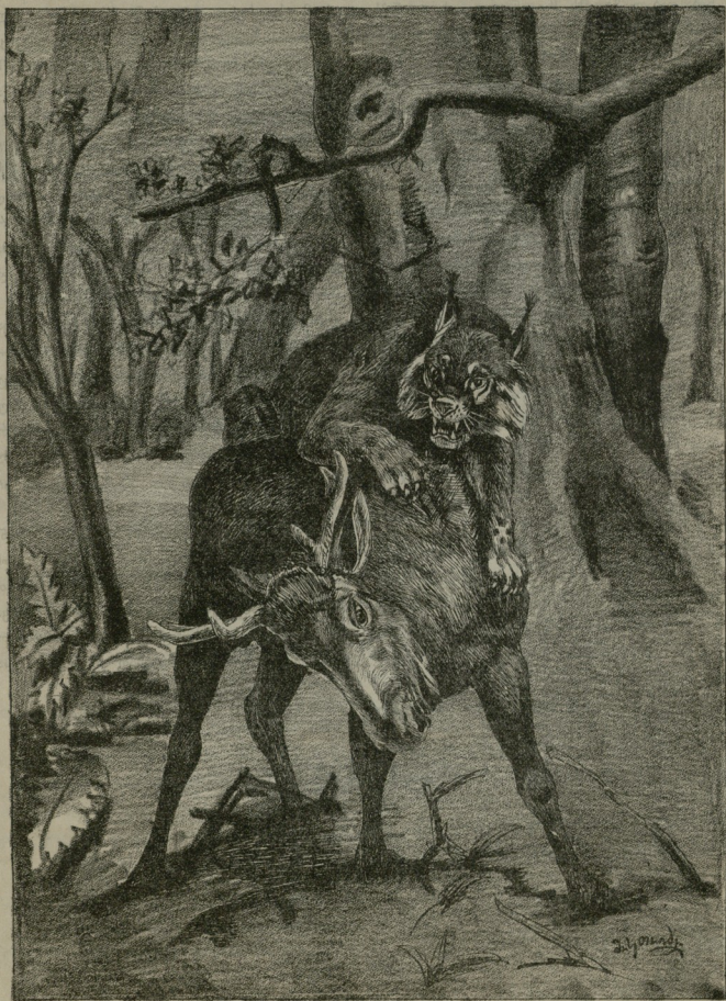
ღრღი კატენი, ირემს დასკეშია ზურგზედა.