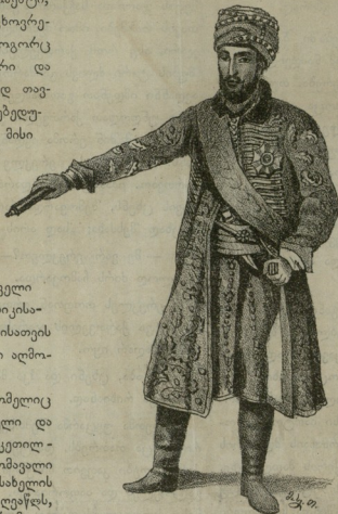
მეფე ერეკლე II

მეფეს ერისას, რომელიც არის ზეგარდამო ცხებული და მოვლენილი ერის საკეთილდღეობთ, ისტორია და მომავალი მოსახოვს, უყვადვის სახელი მოსახეჰედ, ბევრს ისეთს ღვაწლს, რომელიც მარტო მხედართმთავრული ნიჭით არ შეიქმნება. ყველაზედ უმაღლ ისტორია იკითხავს, თუ რამდენად გამრავლებულა ერი და გადიდრებულია ამა და-ამ მეფის ვაგებობას ქვეშ? რამდენათ ზნეობით და გონებით წინ წასწეულა მისი მდგომარეობა, რამდენათ გამრავლებულან მის დროს სკოლები ზე რამდენი მაღალი სასწავლებელი? დაარსებულია რამდენად აყვავებული ეპრობა, აღებმიცემობა და მიერნება გზებისგაუშვარებისობით, არხების გაყვა-