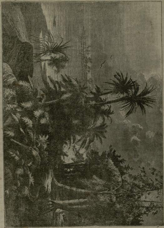
რუსეთში აღმოჩენილი ახალი სახეობის მტკნარი წყლის მცენარეები

ნოებმა და სიცოცხლემ აჯობა ბოროტ სტიქიონის ძალესა. ჯერ ვაჰრადელა მცენარეები, მერე უზარმაზარი ტყეები აიგოა ღირსი ცხოველებითა. ეს აღვილი გასაგებია, თუ არ დავეიწყებთ, რომ ცეცხლ-მქვინავე მთებმა იმდენი სულის შემხუთველი ბული ამოიტანეს მიწის გულიდან, რომ მთლათ მოწამლეს დედამიწის პაქი.