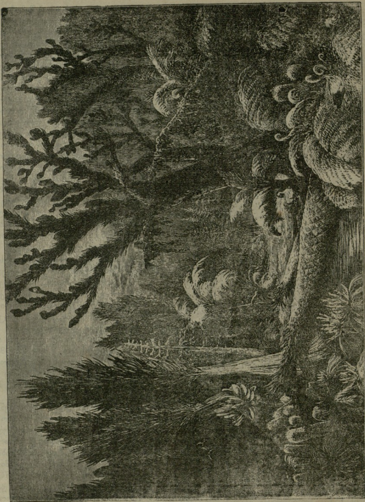
ორი ხანა დედა-მამის სხივებზედანი: შთელი ზედაპირი ხელებისა ტყით იყო დაფარული.