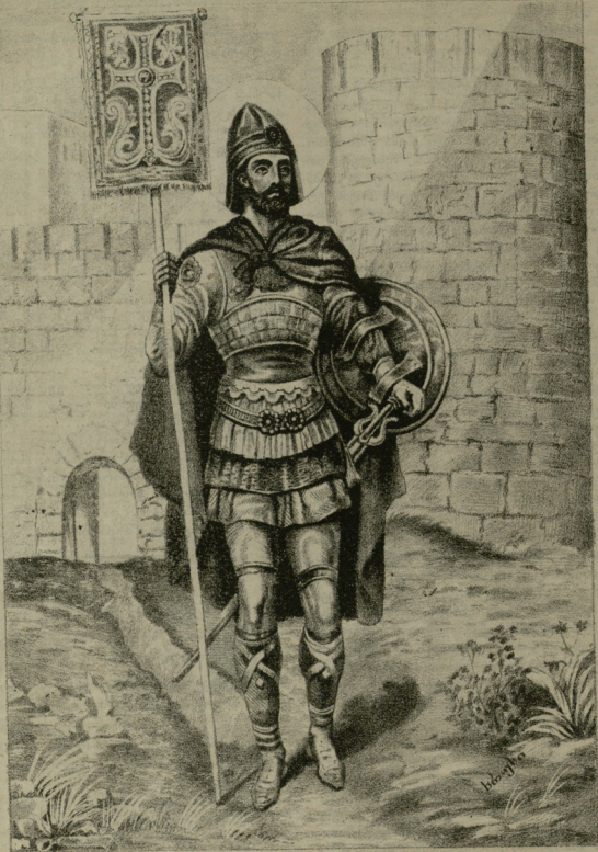
წ. მოწამე გობრონ.