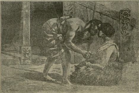
მისალმების ჩვეულება სხვადა-სხვა ტომთა შორის.