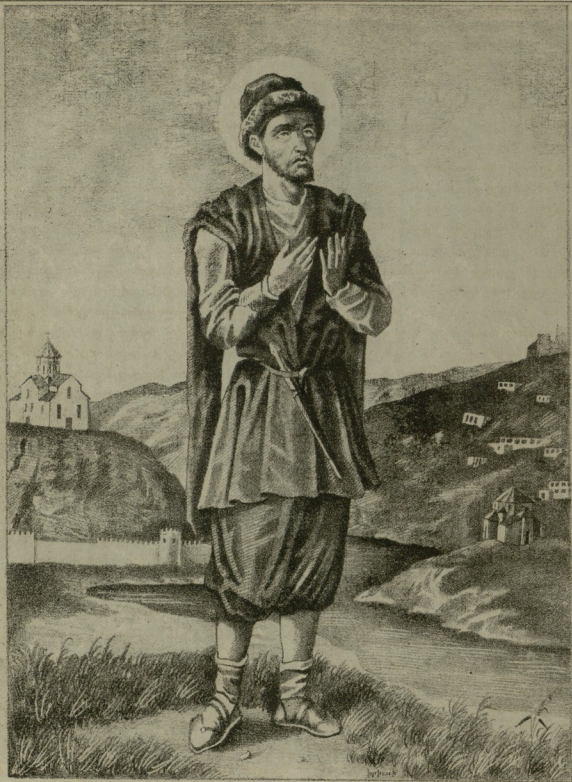
წმინდა მოწამე აბო