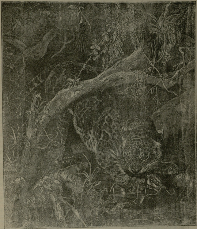
იაგუარი წმინდა მოციქულების ხელობას ეწევა, თევზაობასა

ეს არის, რომ ისინი შიმშილის გამო იცვლიან ალაგს. დიდი ხანია, რაც შენიშნულია, რომ თუ ზამთარი აღრიანათ დადგა, ლემინგები მაშინვე გადასახლდებიან.