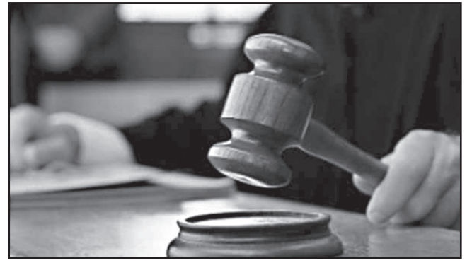
არანაირად არ დამზოგა გარდაცვლილმა, – განაცხადა ბრალდებულმა.

ნაფიცი მსაჯულები მოვითხოვე, მინდა, რომ ხალხმა განსაჯოს...სხვა გამოსავალი არ დამიტოვა, მე ჩემი თავისთვის უნდა მეშველა, იქ მოხდა, რაც მოხდა. ეგ იყო ერთადერთი პიროვნება, ვინც მე სასიკვდილოდ გამიმეტა, სასიკვდილოდ მირტყამდა და ძირს დამაგდო, მე დიალექტიკა ავადმყოფი ვარ.