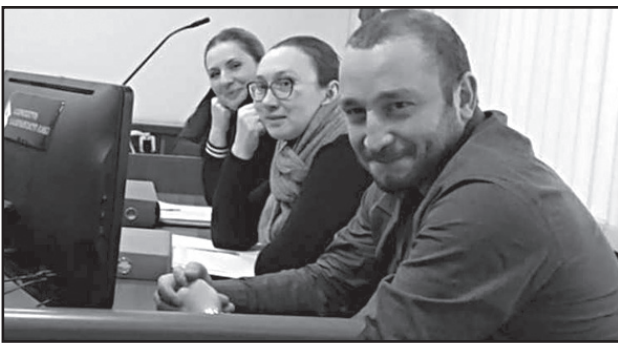
მოთხოვნა დააკმაყოფილა. „მოსარჩელეს უნდა მიეცეს კომპენსაცია 12 თვის შრომის ანაზღაურების ოდენობით, რაც განსხვავდებულ შემთხვევაში 12.000 ლარს შეადგენს.“ – აღნიშნულია 2019 წლის 13 თებერვლის გადაწყვეტილებაში.

2019 წლის 13 თებერვალს, სააპელაციო სასამართლომ, 3 მოთხოვნიდან, მხოლოდ ერთი