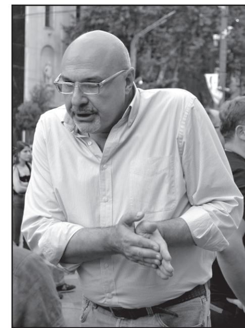
მყოფია, საინტერესოა, ვინ უნდა შემოიკრიბოს?

– ალბათ, ძალიან ენებიან იქნებიან ძირითადად.