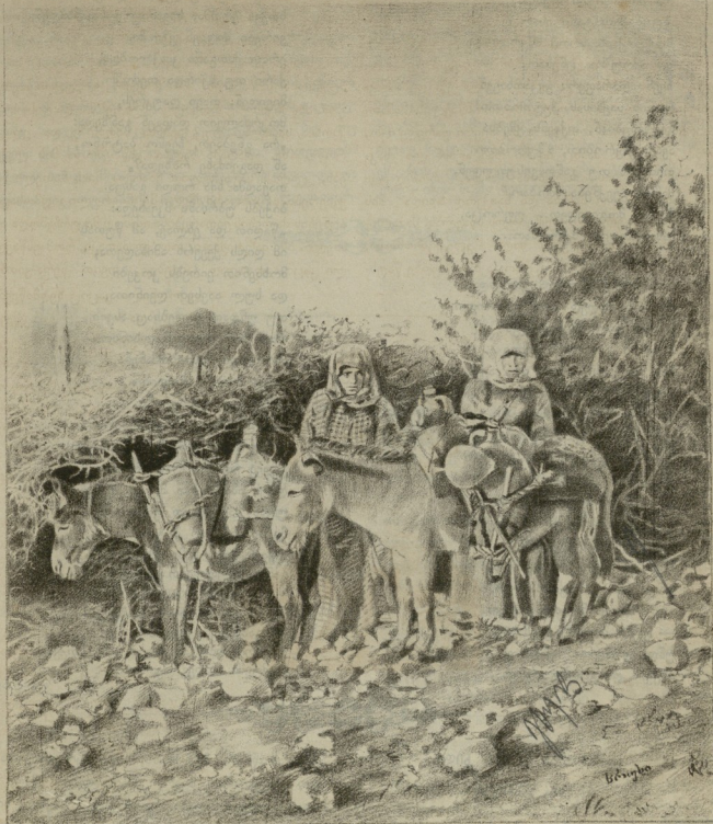
ლით. დემუროვსა თხალის