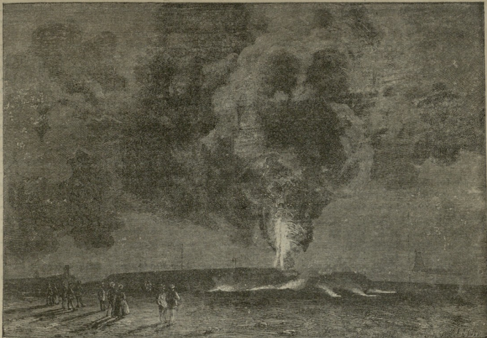
ნავთთან ერთად შადრევანს მრავალი ქვიშა ამოჰქონდა.

სხა და მოგონებას შემდეგ. ბოლოს შადრევანს როგორც იყო რკინის პალოებით, მიღებით და კრანებით პირი შეეკრეს, ჩაუქალეს, მაგრამ დედამიწის გულში დაძლიერებული ვაზი ისე საშინლად აწვიბადა ნავთს, რომ ნავთმაც ახლა სხვა ალაგას სარქველივით ახადა დედამიწის ზურგი და საშინელის ძალით ხელახლად დაიწყო შადრევანს სროლა. ასე გასტანა რამდენიმე კვირა, ვიდრე როგორც იყო არ დაქალეს ახალი შადრევანის პირიც. როგორც ამბობენ, მაშინ 13 მილიონი ფუთი ნავთი დაიღუპა!—მხოლოდ იმითი-ღა ისარგებლეს, რომ ორ დისეტინამდე ადგილზე ორგან ღიღ ტბებდა დააგუბეს და შემთავრეს ნავთის ნაკადულები, მაგრამ ამ ტბების ნავთი რაჟი თავის თავად ამოქრა, ამიტომ აღარ გამოდგა;—ლამპრებში სახმარებელი ნავთი (კეროსინი) ეღარ გაკეთდა, რის გამოც პატრონები იძულებული იყვნენ ფუთი თითო კაპეკად გაეყიდნათ სათბობად—სახმარებლად.