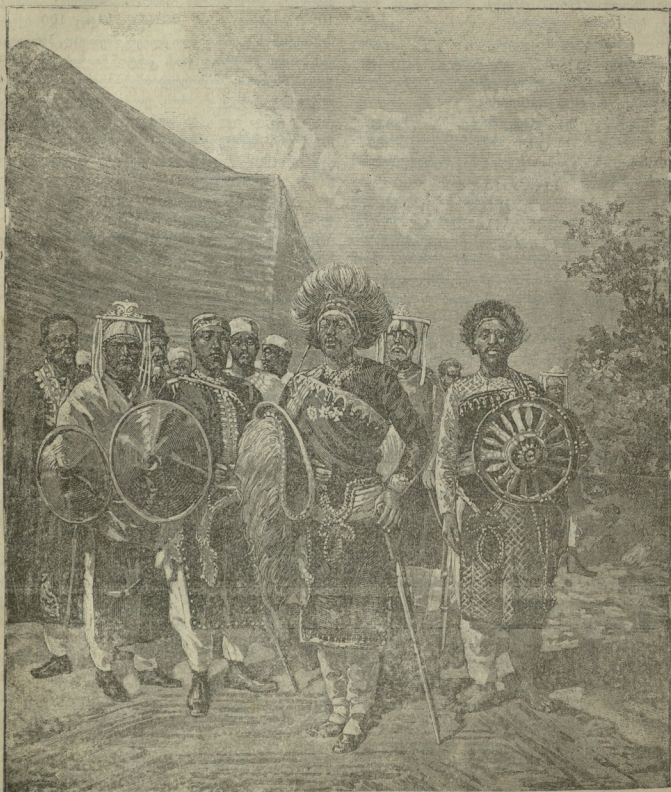
ნეგუსი ითანე ზეორე, ეთიოპიის მეფე.

ღენა ეთიოპიაში და სდომებიათ, როგორც თანამორწმუნენი, დემოკრიზლებიათ ისინი იტალიის საცელმწიფოსთვის, რადგან იმ დროს პაპის სამთავრო თითქმის მთელს იტალიაზე იყო გავრცელებული;