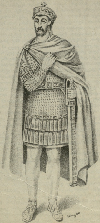
წმინდა მკჷვე არჩილ.

ლებდა ხორასნის მმართველს, ანუ ხალიფს, და იღებდა ხარჯს საქართველოს - მთავრებისაგან. ამიერიდან არაბეთის მზრძანებელი ნიადაგ თვალყურს ადევნებდა საქართველოს და დროგამოშვებით შემოესეოდა ხოლმე ურიცხვი ჯარით, რომ საქართველოს დატლებული ტომებო ისევე არ შვერთებულებიყვენ, არ გაძლიერებულიყვენ. ასეთმა მოქმედებამ არაბებისამ საქართველოში დაამკვიდრა უძლური, წერილობანი პარტიკულარისტობა, განკრძოვნება და მოსპოვება შორის სარწმუნოებრივი და ტომობითი კავშირი. „შემდგომად ორმოცდაათის წლის გარდასვლისა, თუმცა იყო მშვიდობა, გარანა არა მოგებულ იყო კვალსავე თვისსა ესე ქვეყანა“. — ეკითხულობთ ვახუშტის ის-