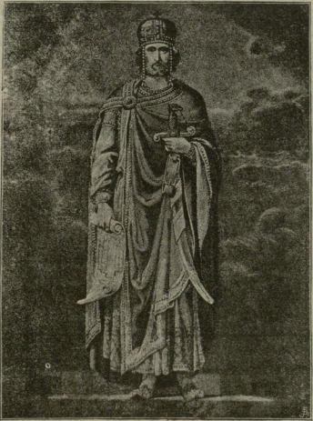
წმიდა მეფე დავით აღმაშენებელი

გვიძლია შევხედოთ რომელი საუკუნის კვალი ატყეია ამა-და-ამ ტაძრის გეგმას, მაშასადამე ისიც შეგვიძლია გამოვიცნოთ იმ საუკუნეში რომელი მეფეები ყოფილან და დაახლოებით რომელს მეფეს უნდა აშენებინოს ესა-და-ეს ისტორიული ძეგლი.