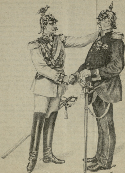
ბისმარკის და გერმანიის იმპერატორის შერიგება.

ქ ნება არც ერთს მამულის შვილს იმდენი ღვაწლი არ მიუძღოდეს თავის სამშობლოსა- ლში, როგორც ბისმარკს. მის დრომდის პრუ- სიის სამეფო საპოლიტიკო ასპარეზზე რუმინიის, ან სერბიის სამეფოს არ აღემატებოდა ღირსებით და სიერთაშორისო უფლებით, რაიცა შეეცება გერმან-