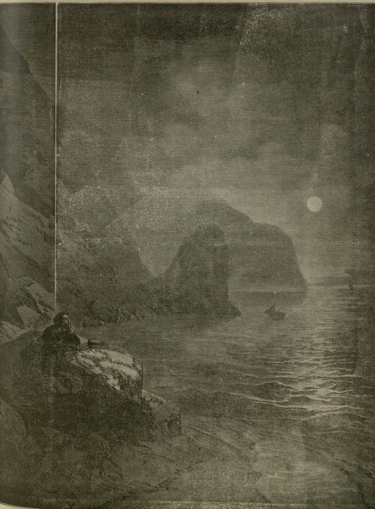
პეშინი შავი ზღვის ნაპირად. (აივანოვის მხატვრობა)