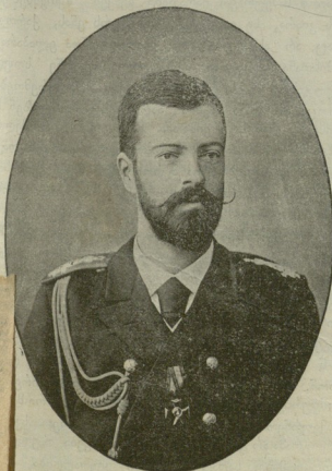
დიდი მთავარი ნიკოლოზ მიხეილის ძე.

შინარსი: სახელმწიფო ქონებათა და სამეურნეო საქმეთა მინისტრის მოპანება ვაკასიაში გ. წერეთლისა—საუერა- დღეო აბზეზი. — კ — ს. დეკსი ასალგაზდა ქართულისა. — მგზავრ. ს შენიშვნებო. — * * * დეკსი ლ. ქ. — დეკლი და პატროსნე- სის დაცვა ფ. პატრიშვილისა. — კრიტიკა: მოამბის პუბლიცისტკა პ. პეტროვისა. — რეცენზია წიგნებისა. — კერძო განცხადებანი.