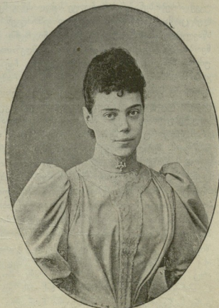
დიდი მთავრინა ქსენია ალექსანდრეს ასული.