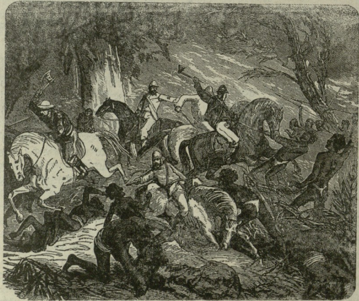
ავსტრალიის უდაბნოში: პირველი წუება გუდუჩუბისა დაჯალბეთ მიწაზე.