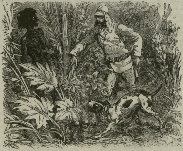
ავსტრალიის უდაბნოში: უკრბა წამოკრბა ზეზე შუშინებული კვლური.

დღეს ავსტრალიაში ხუთ მილიონ ინგლისელზე მეტი ცხოვრებს. ამათ უმთავრეს ქალაქ მელბურნში ორასი ათასი მცხოვრები მეტია. ინგლისი იქიდან ღებულობს დიდ საქონელს, ხორბალს, მატყლს და ქა-გუნდას.