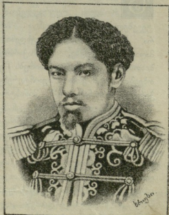
იაზონიის მიკადო (ხელმწიფე)