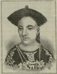
ჩინეთის ბოგდისანი (ხელმწიფე)

გ ველაზე უფრო ნათლათ დამტკიცა თ. ქორდანიამ თვისება ჩინებულის უტყუარის მეისტორიის გელათის ტაძრის აშენების შესახებ. პირველად ბ-ნ თ. ქორდანიამ ავეიტეხა ბა- სი: გ. წერეთელმა გელათისა ვედრების ლეთის- მშობლის ხატზე გამოხატული ბაგრატ III იმერე-