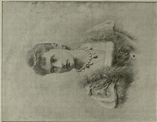
სადის უმცლესით დანამქულა სუღოწიგის იმერტორის.