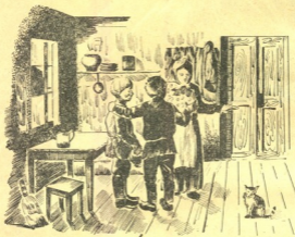
ჩვენ წავალთ მამასთან

შიგნით აუარებელ მუძას მოეყარა თაყი. სვეით, მძაღლ ადგილას იდგა ვიღაც მძაღლი, ჩამომხმარი კაცი. ის ხელებს იქნევდა და სმამძღა იძახოდა: