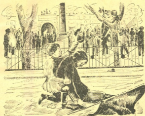
შიორბინა დაქრილ მამისთან

სტეპო და მიძა მიდიან მამის გვერდით და მამას მიაქვს დროშა.