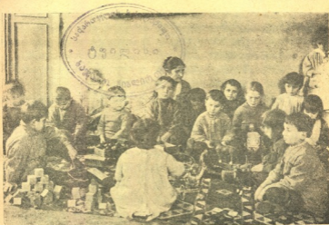
მეორე შრომის სკოლასთან არსებული საბავშვო ბაღის ბავშვები.

პეტო — აბა, ვის არ შია დღეს? მუცელში ბაყაყები მიყიყი- ნებენ!