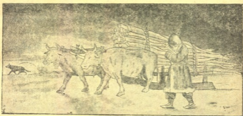
ტყიდან მარხილით შუშა მოჰქონდა.

თორემ გადაბრუნდებოდა... მიუძლოდა წინ სარებს და თან ფიქრობდა: „ეს ძალიან საქმე არ გააკეთეს! დღევანდლამდე საფსულის დღეს დასაღვე წუაღსაც ვერ იძოვიდა კაცი. ახლა კი ძაღვ გამოიხსუსებს ღიანჯის ანკარა წუაღი, მოირწყვება დღევანდლამდე ურწყავი ტირიფონა, მისი მიწაც გაცაცსლდება... დღეს ჰურის მტერი არა მოდის რა, ამ არსის წუაღობით კი გამენდება ბაღები, ვენახები, აუკავდება ჩვენი ტირიფონაც... შენი ჭირიმე, მუშის მარჯვენა!“