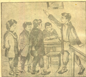
წავიღეთ და დაუფუქვით ხორბალი.

— სთქვი, შვილო, — უთხრა დედამ და ბუნართან ჩამოჯდა.