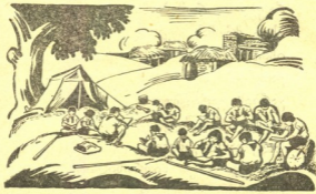
ბ ა ნ ა კ შ ი .

ვეკლავ ჩვენგანმა კარგად იცის ლოზუნგი: „დასურული ოთა- სებიდან გამოდით სუფთა ჰაერზე“.