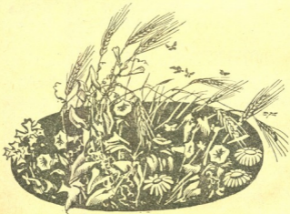
სარვევლა მცენარე ხვართქლა.