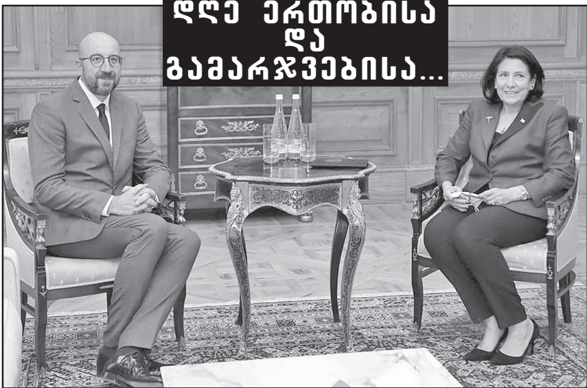
დღე ერთობისა და გამარჯვებისა...

საქართველოს პრეზიდენტმა სა- ლომე ზურაბიშვილმა გაუშინ ევროკუ- ლი საბჭოს პრეზიდენტ შარლ მიხეილს განუხილ ქალისხმევისთვის მადლობა კიდევ ერთხელ გადაუხადა. „ბატონო პრეზიდენტო, კიდევ ერთხელ მინდა, დაგიდასტუროთ ჩემი პატივისცემა და მადლობა მოგასხენოთ იმ ძალისხმე- ვისთვის, რამაც მოგვიყვანა დღევანდელ დღემდე. დღეს დილიდან კიდევ ახალი ხელმოწერებია შეთანხმების დოკუმენტზე, ეს იმას ნიშნავს, რომ ის დინამიკა, რომე- ლიც დაიწყო გუშინ, გრძელდება, ძალი- ან დიდი იმედი მაქვს, რომ მომავალ დღე- ებში, მომავალში კიდევ გაგრძელდება და მივიღებთ სრულყოფილ შედეგს. ეს იქნება და არის უკვე ნამდვილად ყველას გამარ- ჯება, პირველ რიგში ამ ქვეყნისთვის. შეთანხმება, რომელსაც ხელი მოეწე-