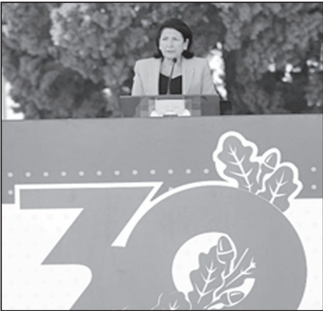
დღეს ქართული ჯარი 30 წლის იუბილეს აღნიშნავს. თუმცა ყველამ კარგად ვიცით, რომ 30 წელი კი არა, ქართული ჯარი საუკუნეების ითვის და ჩვენი დღევანდელი ჯარი არის საქართველოს მიერ გადახდილი ყველა

ომის ღირსეული მემკვიდრე, — ამის შესახებ სალომე ზურაბიშვილმა თავდაცვის ძალების 30 წლისადმი მიძღვნილ ღონისძიებაზე განაცხადა.