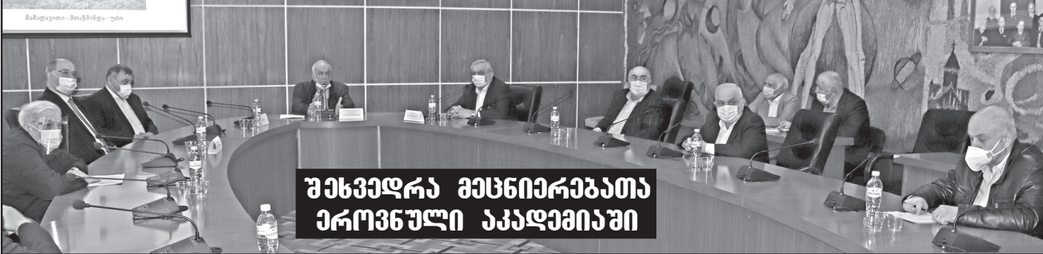
შეხვედრა მეცნიერებათა ეროვნული აკადემიაში