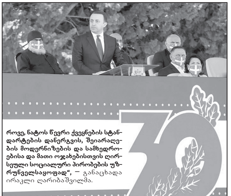
როვე, ნატოს წევრი ქვეყნების სტანდარტების დანერგვის, შეიარაღების მოდერნიზების და სამხედროებისა და მათი ოჯახებისთვის ღირსეული სოციალური პირობების უზრუნველსაყოფად“, — განაცხადა ირაკლი ღარიბაშვილმა.

თავდაცვის ძალები ჩამოყალიბდა, როგორც თანამედროვე, მოტივირებული, ბრძოლისუნარიანი და ნატოსთან თავსებადი ძალა. ის დღეს ქვეყანაში ყველაზე დიდი საზოგადოებრივი ნდობის მქონე სახელმწიფო ინსტიტუტია. ჩემთვის დიდი პატივი იყო და მემამყება, რომ ამ პროცესში, მინისტრის რანგში ქმედითი ნაბიჯები გადავდგით თავდაცვის ძალების გაძლიერების, აღმშენებლობისა და განვითარების მიმართულებით. პრემიერ-მინისტრის რანგში კი გპირდებით, გაგრძელდება და კიდევ უფრო გაძლიერდება ჩვენი ძალებისთვის თავდაცვის ძალების განმტკიცების, თანამედ-