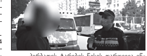
პირბადის ტარების წესის დარღვევა ინვეს ადმინისტრაციულ პასუხისმგებლობას და ასკ-ის 42(11) - ე მუხლის შესაბამისად ჯარიმას 20 ლარის ოდენობით, ხოლო პირბადის ტარების წესის განმეორებით დარღვევა ასკ-ის 42(11) - ე მუხლის შესაბამისად ითვალისწინებს 40 ლარით დაჯარიმებას.

შინაგან საქმეთა სამინისტროს შესაბამისი დანაყოფების თანამშრომლები, ქვეყანაში კორონავირუსის გავრცელების აღკვეთისა და პრევენციის მიზნით, სამართალდარღვევის ყველა ფაქტზე ოპერატიულად რეაგირებენ.