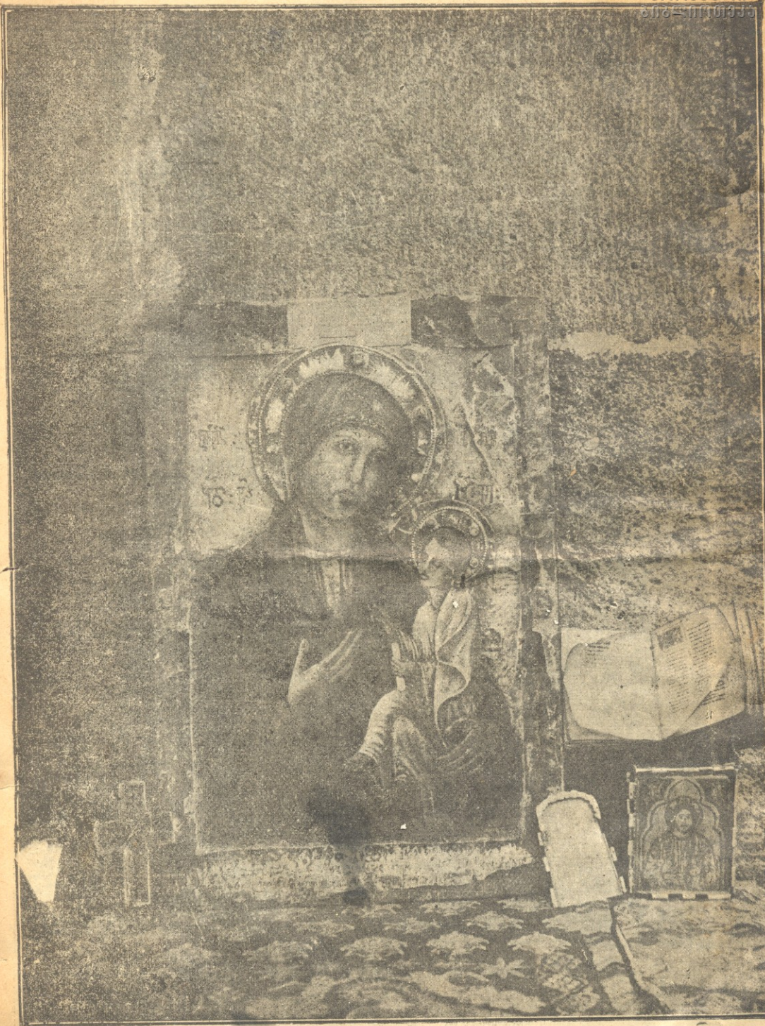
Образъ Пресвятыя Богородицы и древнее евангеліе въ Метехскомъ Соборѣ.