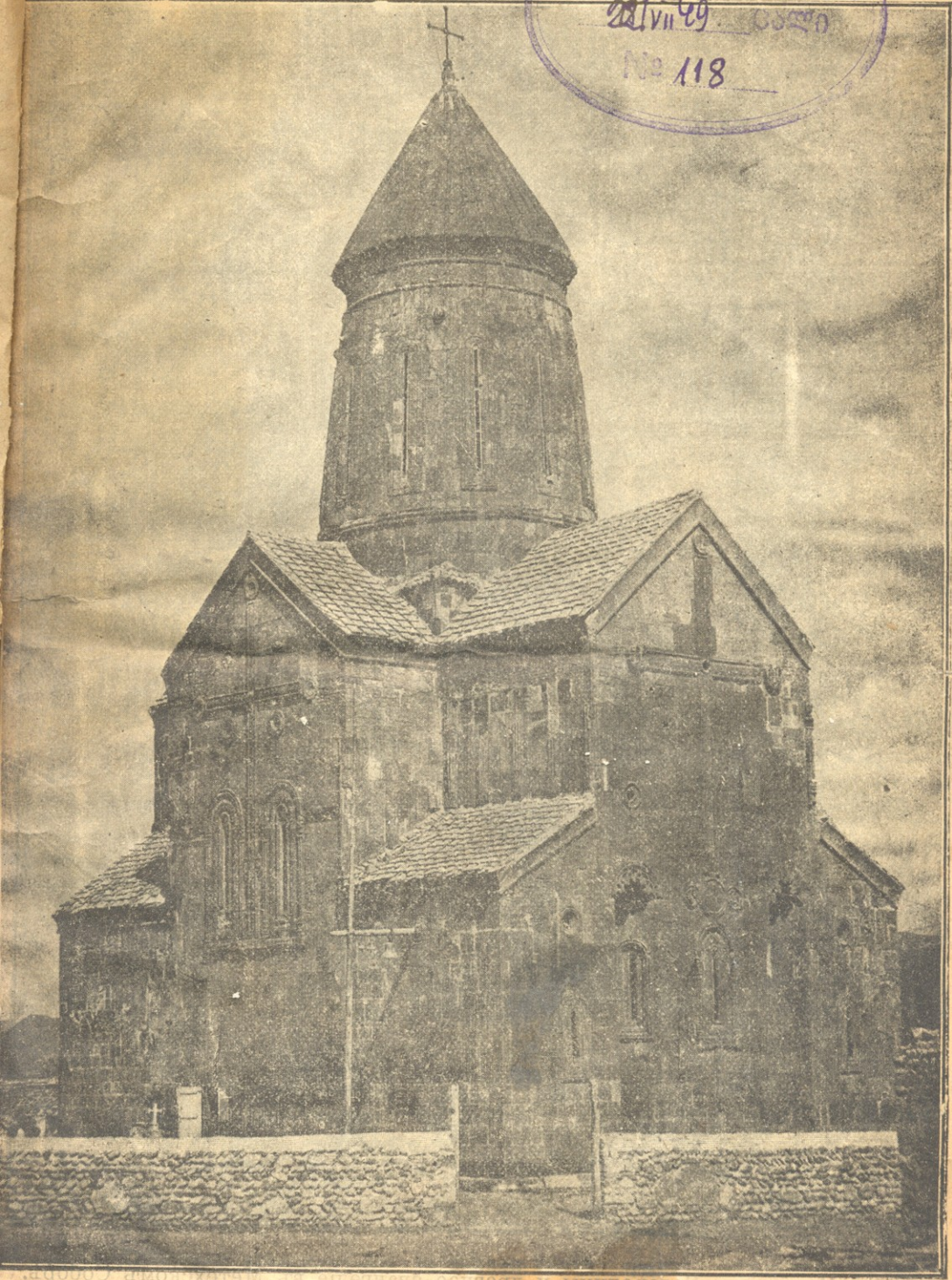
Видъ Метехскаго собора съ восточной стороны.

საქართველოს სახელმწიფო ბიბლიოთეკა თბილისი 104 221 VII 49 № 118