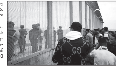
მოამზადა ნიკა თევზაძემ

ესპანეთის პრემიერ-მინისტრმა სეუტაში შექმნილი კრიზისის გამო პარიზში დაგეგმილი ვიზიტი გადადო. ესპანეთის სეუტასა და მედილას ანკლავები ცხოვრების უკეთესი პირობების პოვნის მიზნით ევროპაში ჩასვლის მსურველ აფრიკელ მიგრანტებს დიდი ხანია იზიდავს.