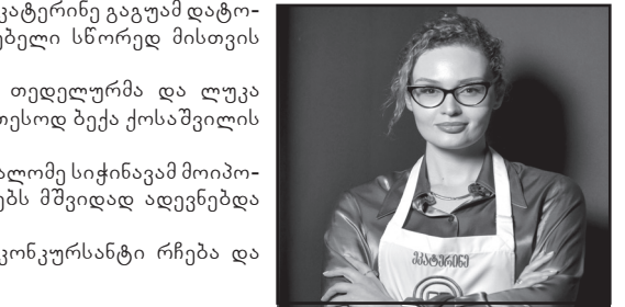
მოამზადა ეკა ირემიაშვილი

„მასტერშეფი“ სულ უფრო ცოტა კონკურსანტი რჩება და შოუც ნელ-ნელა ფინალს უახლოვდება.