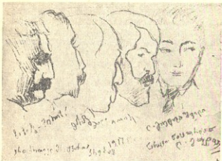
ქართველ მხატვართა კრებაზე. 1917 წ.

ოციან წლებში აშენდა საჯარო ბიბლიოთეკა. ეს არის ერთ-ერთი ნიმუში ქართული არქიტექტურისა. არქიტექტორმა გინმა ძველი ქართული ხუროთმოძღვრების შესწავლას საფუძველზე შექმნა შესანიშნავი ნაგებობა. კალვანი გახლდათ ერთ-ერთი მონაწილე ამ ექსპედიციისა, რომელიც ისტორიულ სამხრეთ საქართველოში მოეწყო ექვთიმე თაყაიშვილის ხელმძღვანელო-