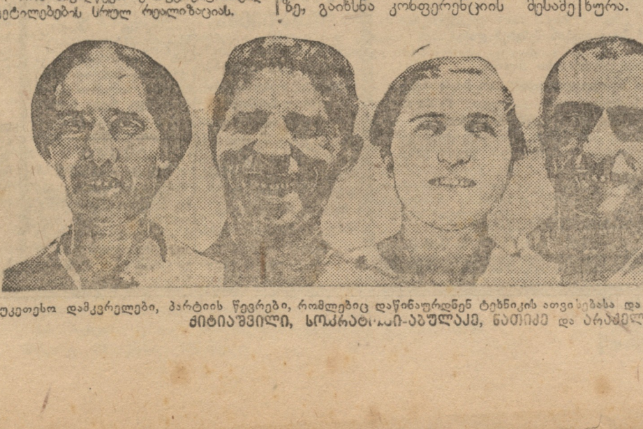
საუბრის დამკვიდრებელი, პარტიის წევრები, რომლებიც დაწინაურდნენ ტექნიკის სფეროში...

საქართველოს კომუნისტური პარტიის 18-ე ყრილობის დასრულება... (Text discusses the congress's role in the national economy)