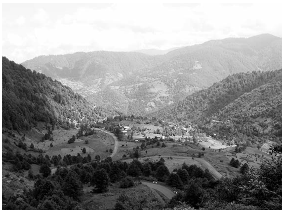
მიჩნევენ და იქ დღესაც დადიან უშვილო წყვილები.

ბაზილიკის ტიპის ყოფილა, დღეს კი ოთხსართულიანი შენობაა.