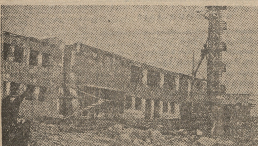
პურის ქარხნების მშენებლობის ხელისუფლების მიერ...