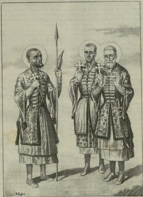
კახეთის წმინდანი: ელისაბარ, შალვა და პიოსი.