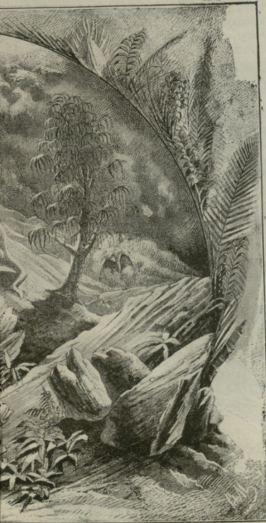
მისა ასა-თახსა წლას წინეთ.

ამერიკის ცხელ ადგილებში ტერმიტებმა საქმე ისე გააკრეს, რომ ძნელათ შეხედვით რაიმე ქალალდს დაკუმენტს, რომელიც ნახევარი საუკუნე შენახულიყოს. არც ევროპიული ტერმიტები ჩამორჩებიან ხოლმე თვითონ ამერიკელ მოძველებს ამ შემ-