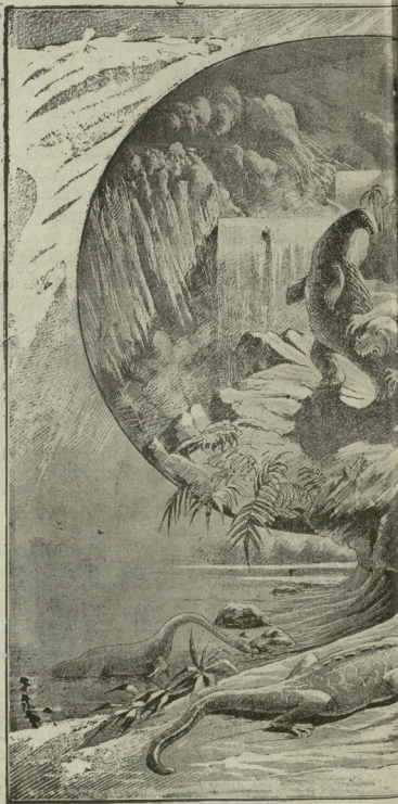
რას წამს ადგენდა ჩვენი

როგორც ჯიანქველები, ტერმიტებიც საშინელი მსუნავი და ღორ-მუცლები არიან. ტერმიტების ბასრ ყბებს არაფერი ქვეყანაზე არ უძლებს, რკინისა