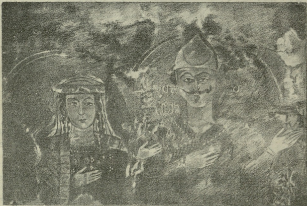
ჭალის წმინდის გიორგის ეკლესია.