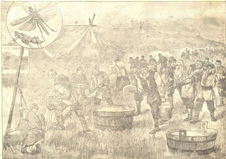
კუტ-კალიის გროკება სამსრეთ რუსეთში.