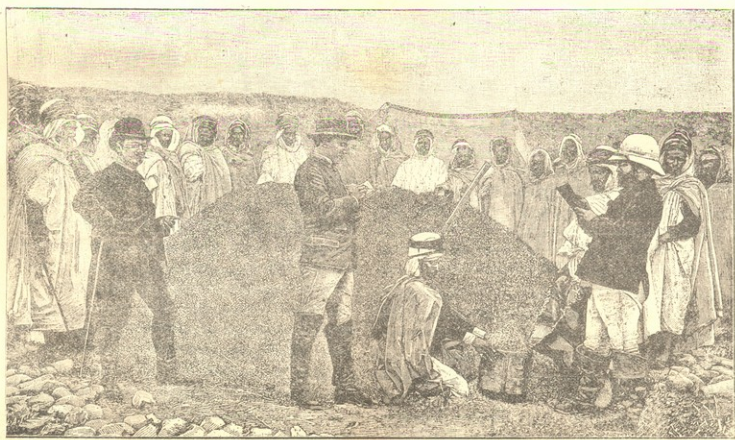
კაღის კვარცხის წკ აღვიწმ.