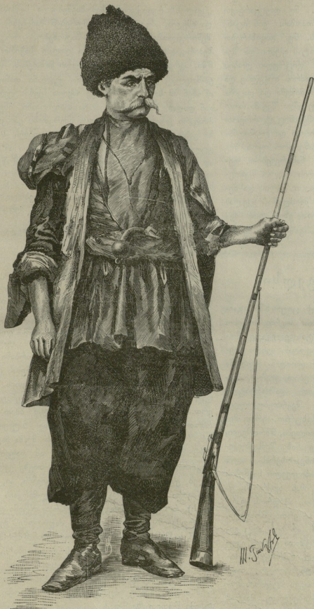
ქართული აღ-მაკმაღ-სანის დროისა.

ვლა ეკადრებაო! აბა, რასა ჰგავს აქაურობა, ამ ტაძრის ეზოში და შიგ ტაძარშიაც, რე თუ ასეთი უსუფთაობა-სინინძურე უნდა სუფედეს? სხვაფერ მოვლა და შენახვა თუ არ შეგიძლიათ ასეთი ძვირფასი ისტორიული ძეგლისა ამ ეზოს მაინც სუფთათ შევიწმინდავდით, რომ კაცს შეეძლოს ტაძრის დათვალიერება ისე, რომ ფეხები არ დასცავოს. მეცოდები ისტორიულა ძეგლა, მეცოდები შეწინააღმდეგებ ტაძრის ნანგრევო, რომ არ გაფასებენ შენნი უზრუნველნი პატრონნი! ეს ძეგლი რომ ფინების იყოს, გინდ რუსების, მაშინ აქ შემოსვლას და ამის ნახვას არაფერი ემაჯობინებოდა, ისე იქნებოდა აქაურობა გასუფთავებული და ვარდ-ყვავილეებით გაშენებულიო, ირგვლივ ქვითკირის ვალაყანი ექნებოდა და ან რკინის მავთულებით შემოვლებული იქნებოდა და კარზე დარაჯი დაყენებული, რომელიც დღეში ასობით მნახველს მიიღებდა ბილეთებით და არც არაფერ დაიხარებდა ასეთი საწინააღმდეგობის ფულის გადახდასო. სრულიად გეოგრაფიკული ეუპასუხე ჩემ მეგობარს ისე დამებნა დავთარი, თუმცა ალა წინდაწინვე ვატყობდი, როცა ტაძრის ეზოში შევიდით, ასეთ საყვედურს მომპრეტყამდა; როგორც ყაყაო, ისე გავწითლდი სირცხვილისაგან; საითაც ფეხი გადავდგიტ ყოველგან პირუტყვის განავალი ევლო და ვარდ-ყვავილების ნაცლათ აწული, დეარძლი და ეკაო; გარდა ამისა ირგვლივ ზოგიერთ მოსახლეებს ნარეცხი წყალი და ყოველგვარი უსუფთაობა ტაძრის ეზოში