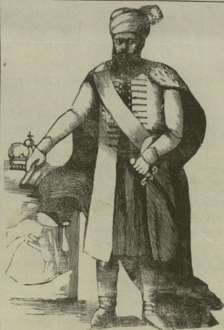
მეფე ერეკლე II (მატარა კასა).

მ ეფე ერეკლე შუა- ტანის კაცია, ფიცხი ხსიათისა, თვალს უკრის. როცა ელაპარაკე- ბიან, შუბლ ქვეშ გამოი- ცქირება ხოლმე, თით- ქოს ჰსურს შიუხედეს მო- საუბრეს გულისწადილსა. ბეჭებში ცოტათი მოხრილია მოხუცებულობის გამო. სა- მოცდაორი წლის კაცი არ- ის, მაგრამ ჯერ კიდევ მზნეთ არის. მეფე ერეკ- ლე ერთი იმ კაცთაგანია, რომლის პასუხშიაც „პოც“ გამოითქმის და „არაც“ თავისებური აზრის კაცია;