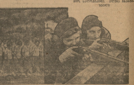
სოფ. ბუკნარის კოლმეურნეობის ქალები (ქობულეთის რაიონი) დამკრძალებელი მოთხოვნების წინააღმდეგობის გამოხატულება.

სოფ. ბუკნარის კოლმეურნეობის ქალები (ქობულეთის რაიონი) დამკრძალებელი მოთხოვნების წინააღმდეგობის გამოხატულება. ქალები აცხადებენ, რომ მხოლოდ დამკრძალებელი შრომა შედლებულია.