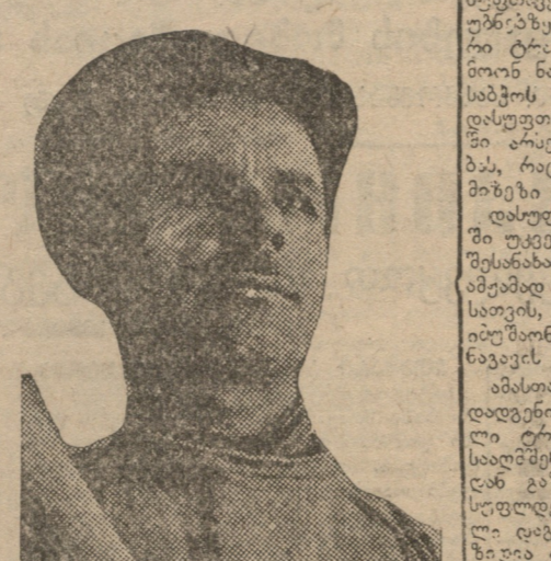
დამკვეთი მეფე ამხ. სიმონიძე