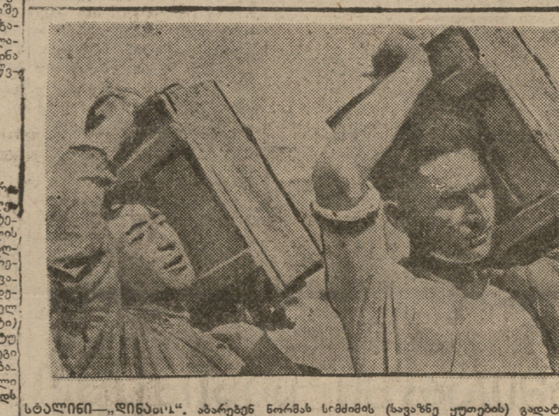
სტალინი-ლინინის... აპარტინ ნორმა...