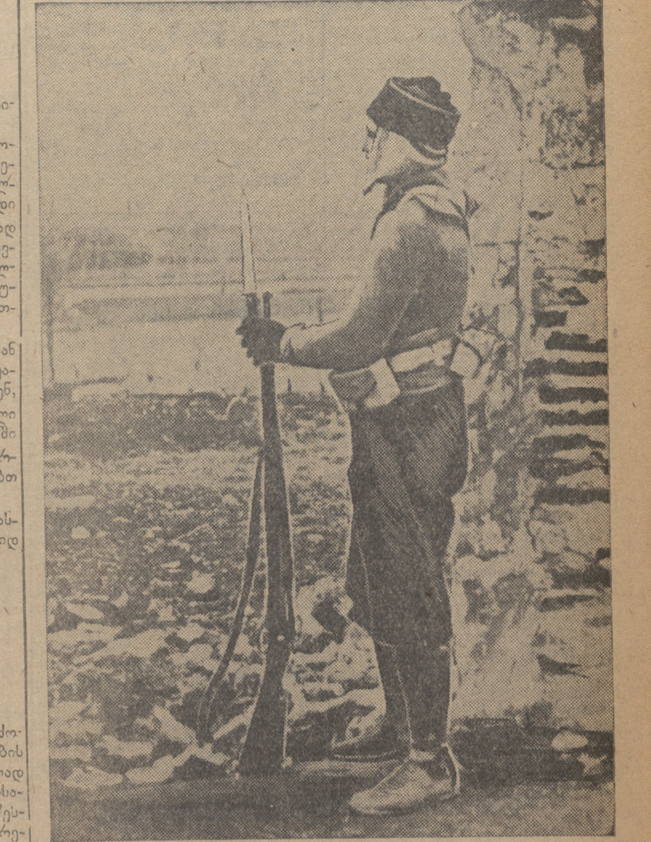
მასადონის მთავრობის წარმომადგენელი საბჭოთაო არმიის წინა ხაზში