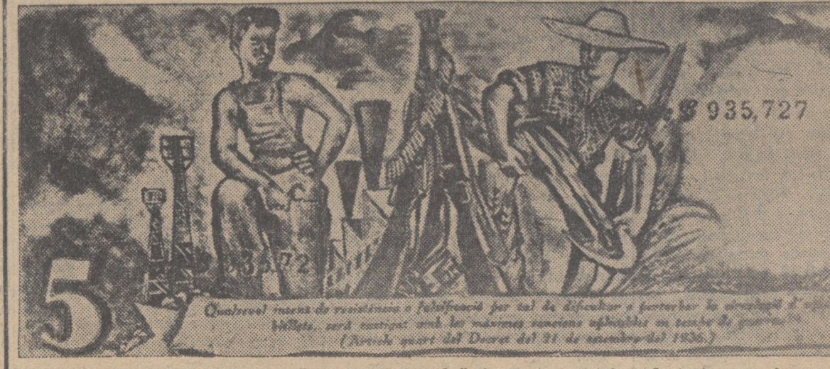
კატალინის მთავრობის მიერ 1936 წ. 16 დეკემბრის გამოცემული ახალი 5-პურებიანი საკრედიტო ბილეთი. ზღ და მობატული მუხა და გლობალი, შუამ-საბი მაშინა და ტყვადრეკვეთის მტერი.

საერთაშორისო დაწესებულებათა საბრძოლო ამოცანა. საერთაშორისო დაწესებულებათა საბრძოლო ამოცანა.