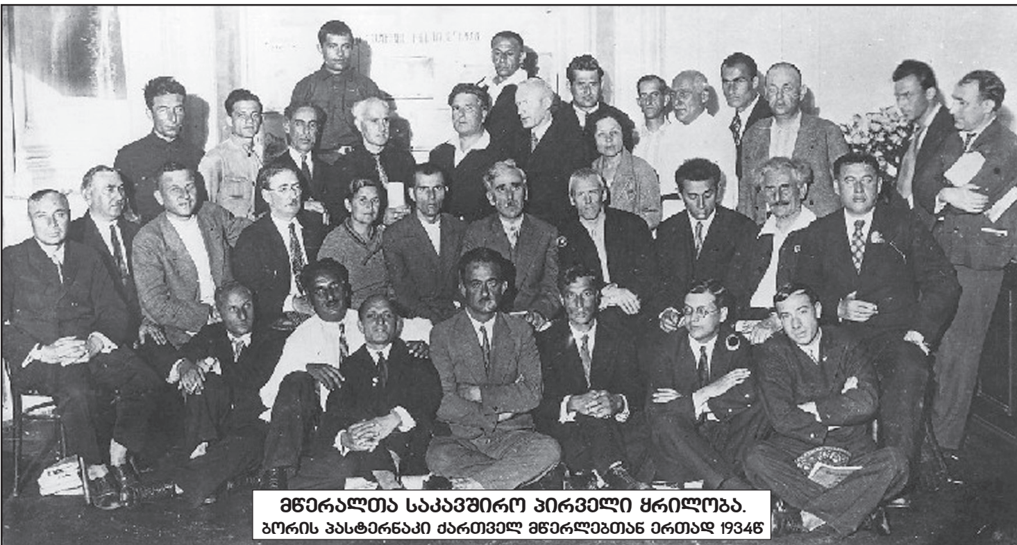
მხარელთა საკავშირო პირველი ყრილობა. ბორის პასტერნაკი მარცხენა ყრიბის მხარეს 1934წ.

დიდებული რუსი პოეტი ბორის პასტერნაკი საქართველოში პირველად ესტუმრა 1931 წლის გაზაფხულში. თავის ავტობიოგრაფიულ ნარკვევში ახშირდელ მთაბრუნელებს ასე იხსენებდა: