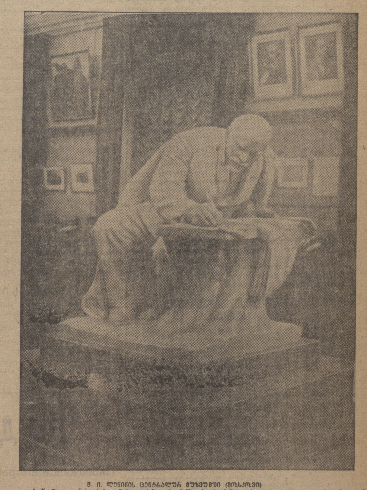
ს. ი. ლეონოვი ცენტრალური საწარმოო (ფოსტოვი) სერვისზე „ლენინის რაზმში“ — კანდიდატი პირველი (ლენინგრადი)

პერიოდი, 3 აპრილი (საქმის). რუსულ-კავალერიამ შეტევა წინ მიიწვეს რუსულ-კავალერიამ. რუსულ-კავალერიამ შეტევა წინ მიიწვეს რუსულ-კავალერიამ. რუსულ-კავალერიამ შეტევა წინ მიიწვეს რუსულ-კავალერიამ.