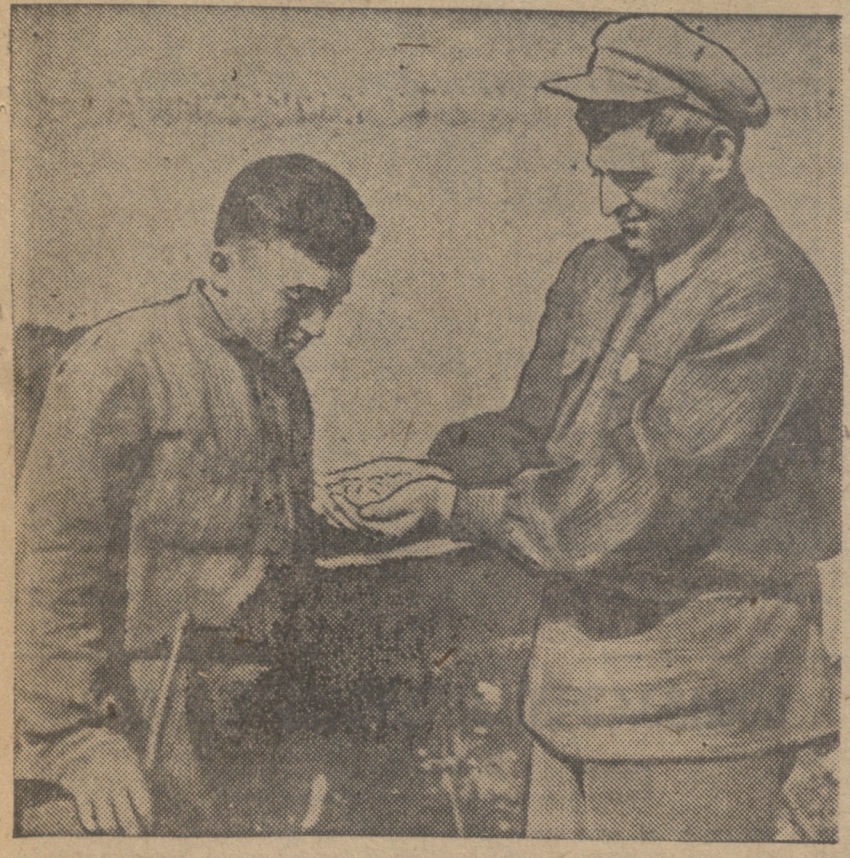
ზარდელთა ხანა-თესვაში შრომის უმჯობესების მიზნით რედაქციის დაწესებულებაში