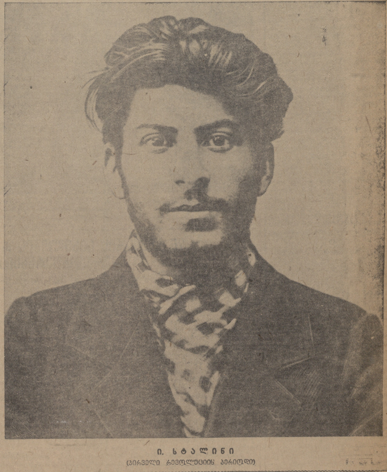
ო. სტალინი (კვირის გაზეთის მდიური)

სრულიად საქართველოს სსრ-ის ადგილობრივი გაზეთი... დაგეგმვების შესახებ და მათი მნიშვნელობა.