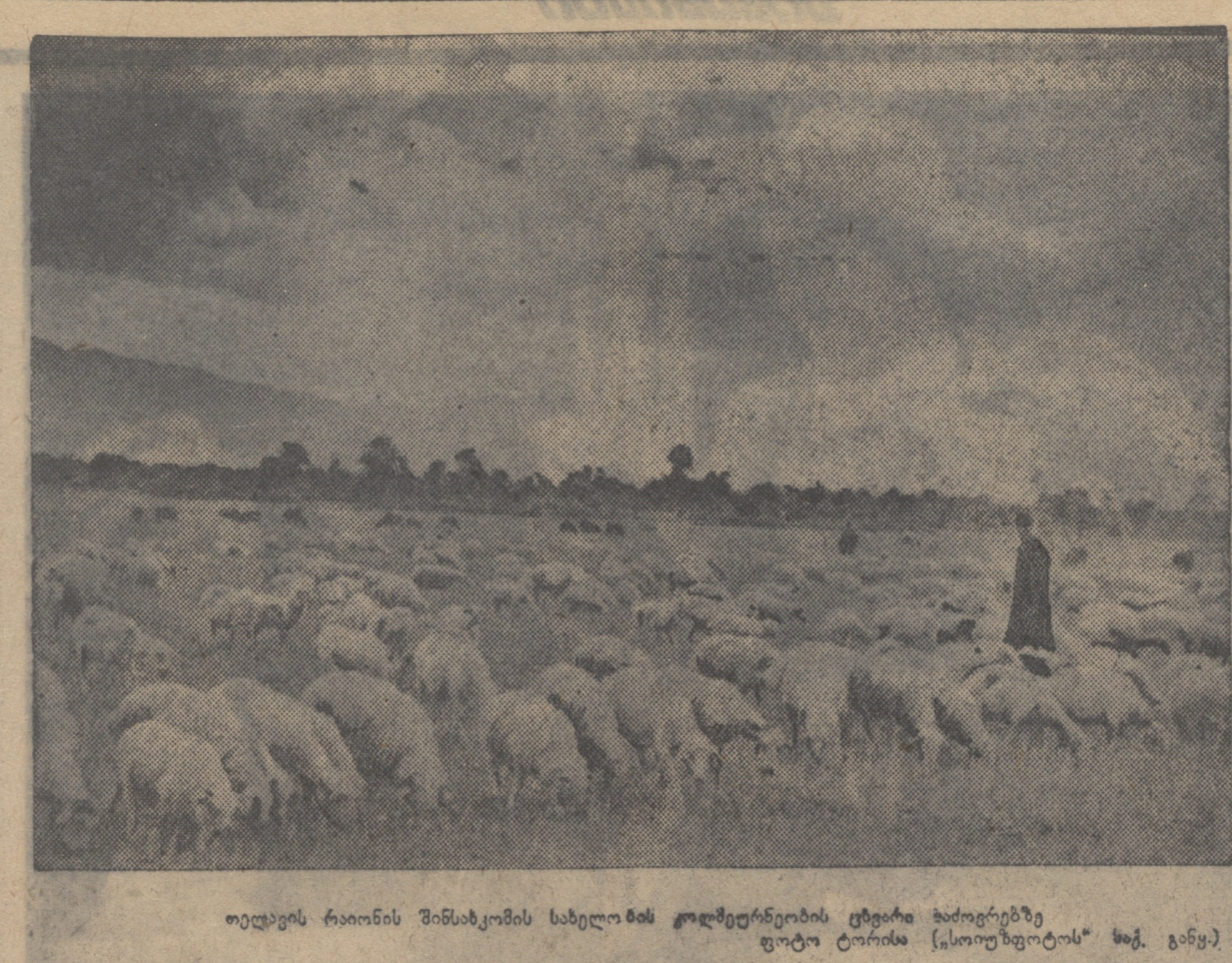
ოვდის რაიონის მინსკის სახელობის კოლმეურნობის ცენტრის მიდამოებზე ფოტოგრაფია (სოფლისკულტურის სექტორი)