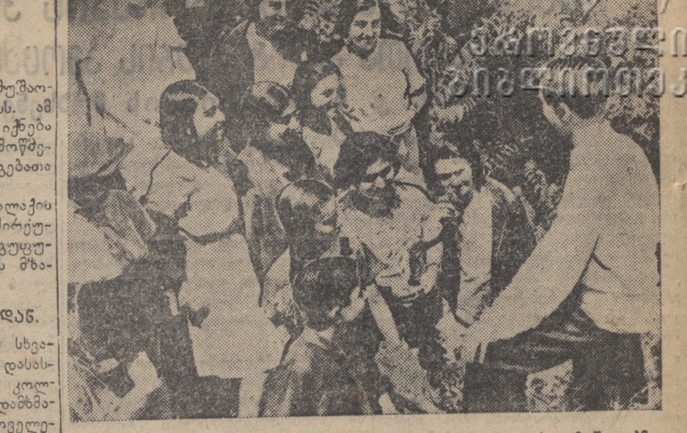
სასწავლო წლის დასრულებისთანავე დაკავშირებული მსიკოსთა სასწავლებლის კურსდამთავრებულთა პირველი გათავაზება.